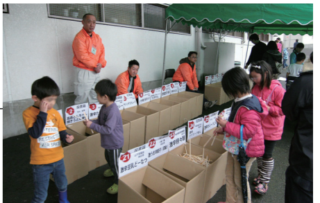
たくさんの方が投票してくれました