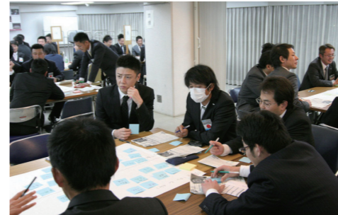
ディスカッションの様子