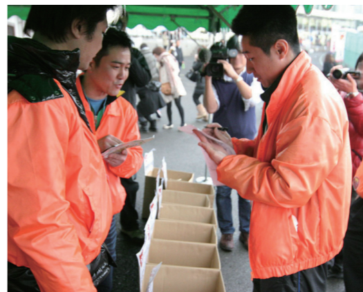
激熱な投票の様子

まずはこのイベントのもう一つのメインである「辛ガールコンテスト」の結果発表が行われ、最終エントリーに残った六名が京都向日市を元気にするご当地アイドルユニットになることが発表され、会場も大変盛り上がり上がっていました。その後、各店舗の代表者が入場し、いよいよ受賞店舗が発表されます。各店舗の代表者は緊張した面持ちで結果発表を待つ中、十位から順に発表され、ゴールドグランプリには向日市の激辛坦々麵「麒麟園」が、シルバードグランプリには向日市の激辛カレーうどん「はなこ」が、ブロンズグランプリには東京のサムゲタン「鳥一代」がそれぞれ選ばれ、受賞された店舗の代表者は喜びいっぱいのコメントをされているのが印象的でした。