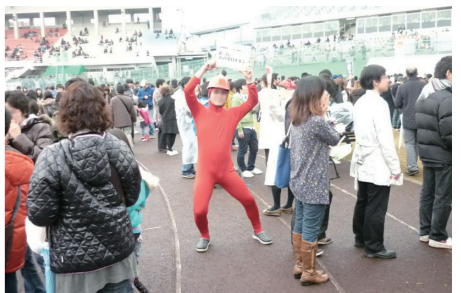
中にはユニークなお兄さんも...